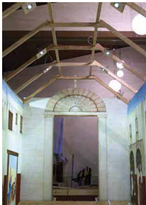
Hier wird der „Einzug nach Jerusalem“ noch aufgebaut werden

Wir erfuhren dann, dass zwischen den Jahren das Zinzendorf-Haus eigentlich nur ausgeräumt werden sollte, aber weil so viele Leute zum Helfen gekommen waren, haben diese auch gleich angefangen und schon weiter gearbeitet. Beim Rundgang durch den zukünftigen Ostergarten ist mir klar geworden, dass Gott hier jeden mit seinen Gaben gebraucht und jeder, der hier schon gearbeitet hat, sein Bestes geleistet hat. Es ist spannend zu sehen, wieviel gute Laune beim gemeinsamen Arbeiten an solch einem von Gott getragenen Projekt entsteht.